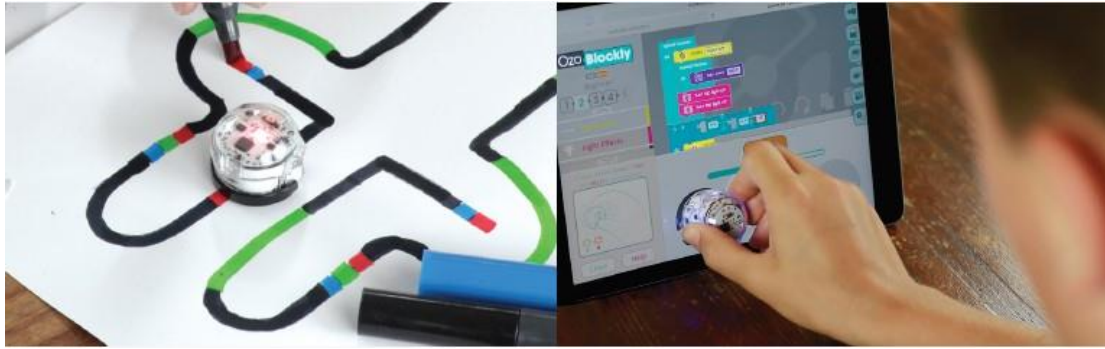
Ohne Bildschirm - mit Farb Codes